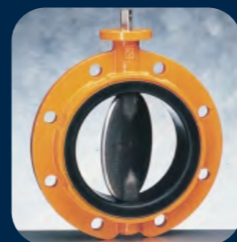
EVMS / EVML