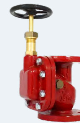
Boîtes de décharge