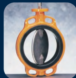
EVBS / EVBLS