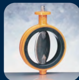
EVS / EVL