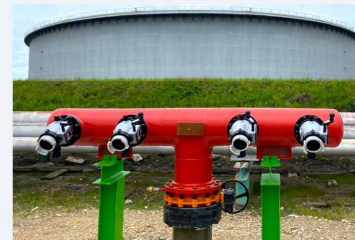
Installation sur hydrant