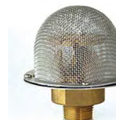
Micro-générateur De mousse Protom®