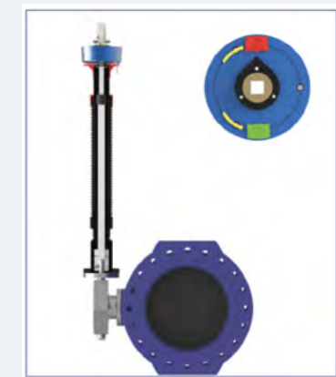
La vanne entièrement fermée