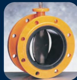
EVFS / EVFL