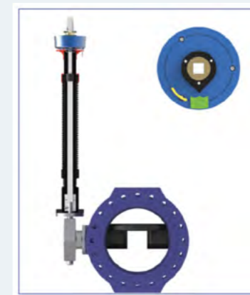
La vanne entièrement ouverte