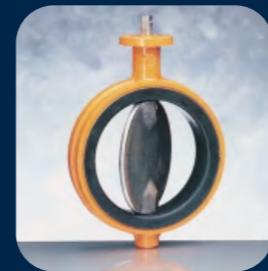
EVS / EVL