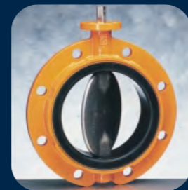
EVMS / EVML