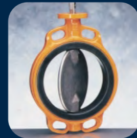
EVBS / EVBLS